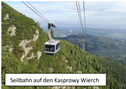
Seilbahn auf den Kasprowy Wierch

Nichtmitglieder können nur bei freien Plätzen berücksichtigt werden.