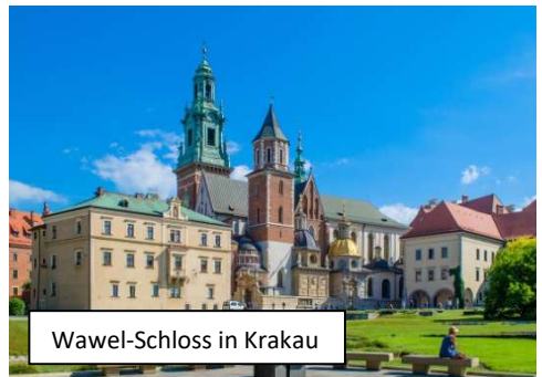
Wawel-Schloss in Krakau