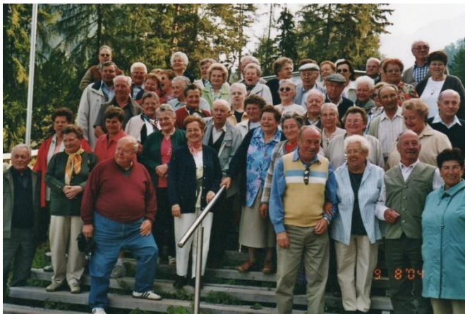
Urlaub Ötztal 2004