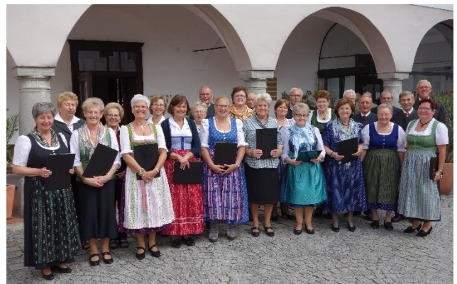
Seniorenchor 2017 beim Bezirkssingen in Zeillern