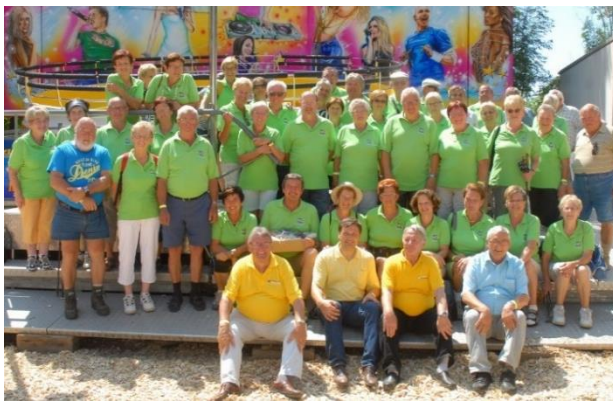
Siegergruppe Senioren Wallsee-Sindelburg beim Bezirkswandertag St. Valentin 2014