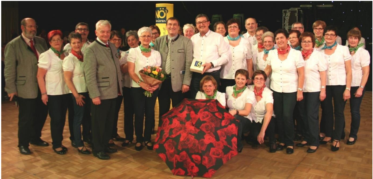
„Mitternachtseinlage“ der HerbstzeitRosen beim NÖ Seniorenball 2017